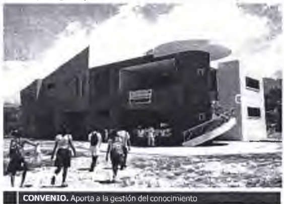
CONVENIO. Aporta a la gestión del conocimiento

torio de Ciencias de la Salud I etapa, remodelación de aulas de la Facultad de Ciencias de la Salud ubicada en el Hospital II de Tarapoto, Construcción de oficinas administrativas de la Facultad de Ingeniería Civil y los servicios Higiénicos del Laboratorio de Formación General.